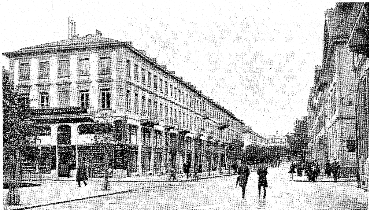
Poststrasse, Schützengasse bis Waisenhausstrasse; Nordseite vor 1914